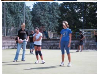
Momenti della Giornata delle Associazioni 2006