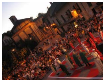
La Chiesa di Villa splendido sfondo alla partita a scacchi.

Organizzare spettacoli da svolgere in contemporanea con scenari e contenuti diversi non è stato facile, ma molto stimolante e, alla fine, appagante.