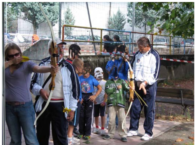
Giornata delle Associazioni 2006, prove di tiro con l'arco.