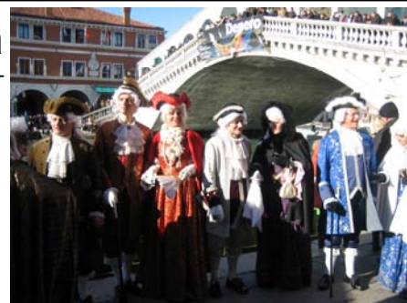
Il team Pro Loco a Venezia 2009

I partecipanti all'iniziativa potranno assistere a questa antica usanza inizialmente praticata da giocolieri, oggi sostituiti da un personaggio famoso ben ancorato che 'vola' dal campanile in piazza San Marco.