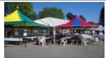
Immagini dalla Festa di San Nicola

Ad ottobre, infine, il tour enogastronomico a Diano d'Alba.