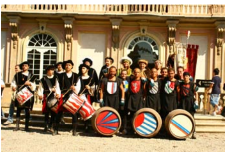
Il team pro loco a Belgioioso

Abbiamo cominciato Sabato 29 e Domenica 30 Agosto con la partecipazione a "Medioevo in mostra" nella splendida cornice del Castello di Belgioioso, una Mostra Storica Medioevale a livello internazionale con oltre 140 espositori provenienti da ogni parte d'Italia e del mondo.