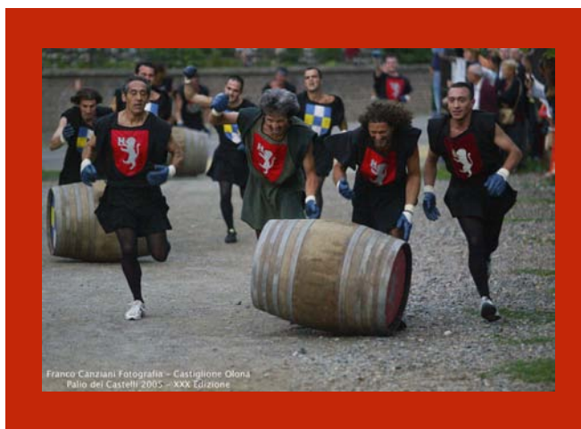
Castiglione Olona Palio dei Castelli 2005 – XXX Edizione